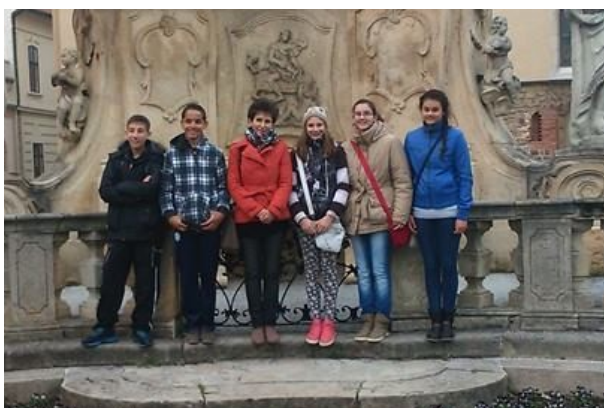
A kiránduló 7. osztályosok osztályfőnökükkel a királynék városában

Úticélunk a Veszprémi Állatkert volt, de útközben meglátogattuk a Szigligeti Várat is. A várfalról szép kilátás nyílt az őszi, kicsit ködös Balatonra és a Balaton-felvidékre. A Veszprémig tartó úton sorra megcsodáltuk a Dunántúli-középhegység nevezéseit, a tanúhegyeket és a Badacsonyt, de jártunk Nagyvázszyban is.