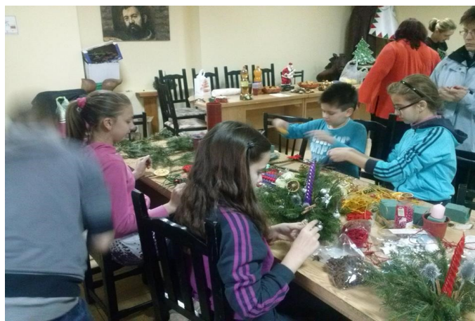
Készülnek a szebbnél szebb adventi díszek