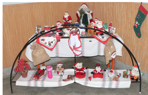
A mikuláskálifítás részlete

Mint minden évben, idén december 5-én is ellátogatott a Mikulás iskolánkba. Versekkel, dalokkal vártuk őt, cserébe ajándékkal kedveskedett nekünk.