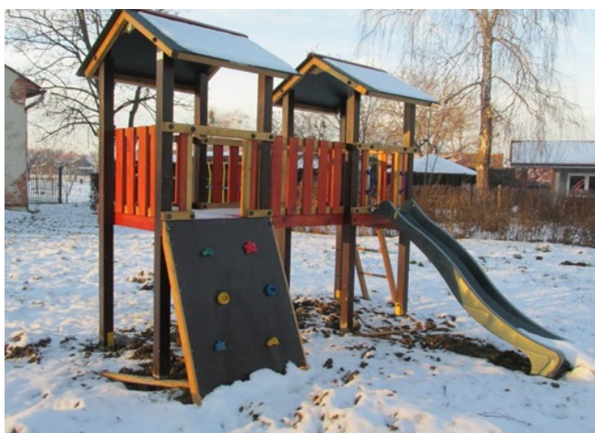
Az udvari játékok az óvodában

A Pék patak „megtisztulásával” ismét megközelíthető lesz a Zubogó is, ami a régi rendeltetése szerint ismét „üzemelni” fog.