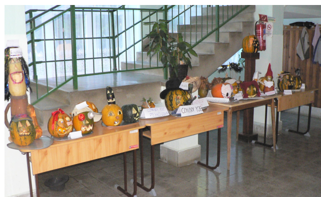
A halloweenre készült „műalkotások” az iskola aulájában

Ősszel a halloweenhez kapcsolódva osztálydíszítő, illetve tökfárgó-versenyt rendeztünk az osztályokban.