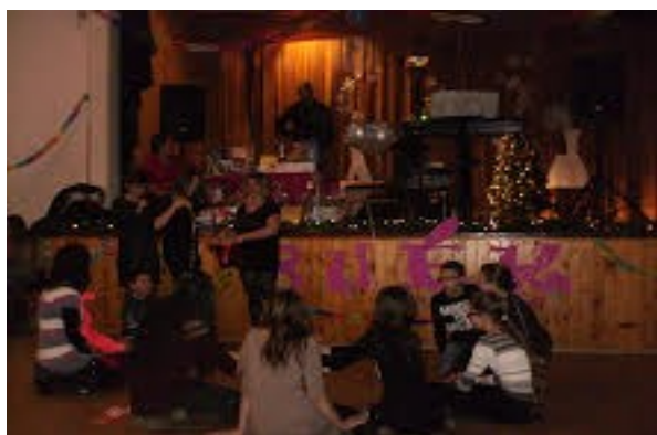
Az új évet ünneplők

lás gyerekekre fordítjuk. Hozzájárultunk színházlátogatásokhoz, kirándulásokhoz, jutalomkönyvek vásárlásához, a nyári táborozáshoz, mikulásra cso-