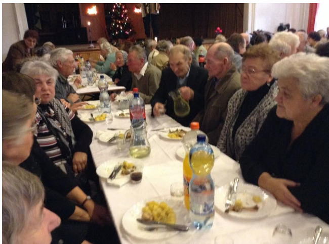
Településünk szépkorú polgárai jókedvű beszélgetés közben.

Egy vidéki nagyváros katolikus templomának bejá-