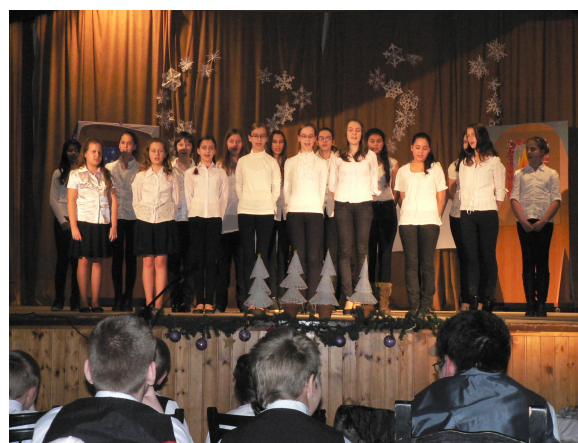
Az iskola énekkara a rendezvényen

Iskolánk tanulói rendszeresen színvonalas, igényes műsorokkal készülnek a nemzeti- és vallási ünnepekre. Az advent és karácsony közeledtével ismét szorgos készülődés vette kezdetét. Ennek