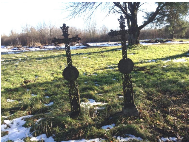
Fejfák a régi temetőben

Nemcsak a jelennek és a jövőnek élünk, hanem ápolni kell a múltat, az ősök emlékét. Az önkormányzat a dolgozóival megkezdte a régi temető rendben tartását. A bokrok és cserjék kivágásával előbukkant sok szép régi síremlék, amiket kár lenne az enyészetre hagyni. A régi temetőben álló kereszt felújítása is szerepel a tervben. Tavaszig eldől, hogy fel lehet-e újíteni vagy újnak a felállítása szükséges-e.