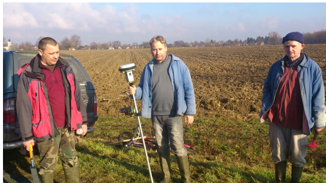
Munkálatok a pataknál

Mivel a patak töltése szomszédos a magántulajdonban lévő földterületekkel, ezért az első lépés a tisztítás megkezdése előtt az volt, hogy a gát terjedelme kimérésre kerüljön.