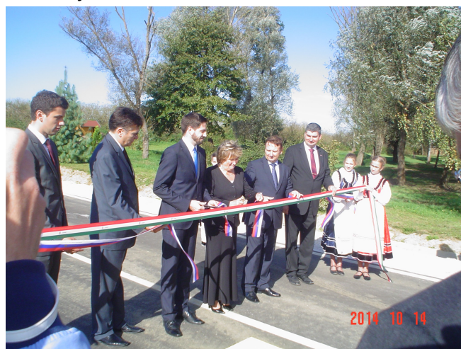
Szalagátvágás az útátadáson

Nagy nap volt ez, amire sokáig fogunk emlékezni, mivel az újonnan átadásra került útszakasz