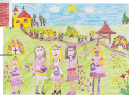
Tüske Hanna rajza