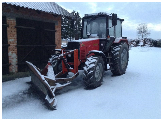
Az új traktor a felszerelt hóekével

A kaszálások megoldására pedig tervben van egy